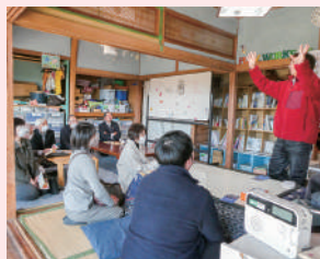
プレーワーカーズ 様