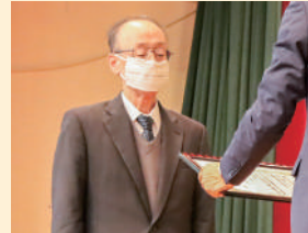
九戸村舞踊研究会 様