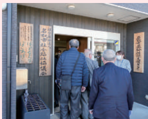
名取市社会福祉協議会 様