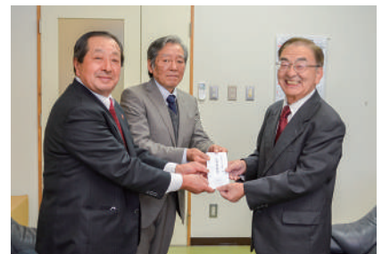
社会福祉法人 九戸福社会