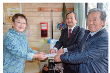
特定非営利活動法人ふぁーすとシート

皆様から寄せられた募金は、年末にお見舞い金として、民生委員を通じて各世帯へ届けられました。 また、各施設へは当協議会長および民生委員児童委員協議会長が訪問し、届けられました。