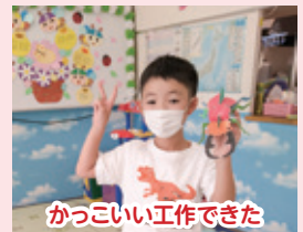
かつこいい工作できた