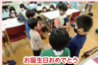
お誕生日おめでとう