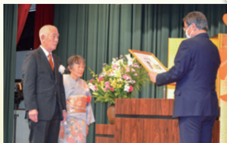
金婚の章を受ける七戸様ご夫妻