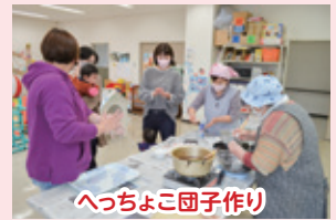
へっちょこ団子作り