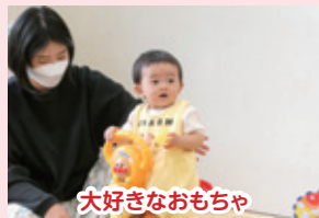
大好きなおもちゃ